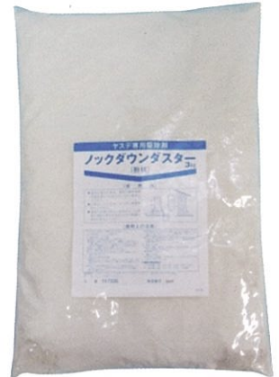
ノックダウンダスター 3kg