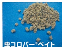
虫コロパー ® ベイト